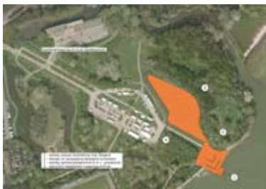
Botenhelling in Julianapark

Hoorn heeft een enorm lang waterfront. Hier moeten alle vormen van waterrecreatie een plaats kunnen krijgen. Dit vraagt om een integrale professionele benadering waarbij de belangen van de verschillende gebruikersgroepen op een zorgvuldige wijze op elkaar afgestemd worden.